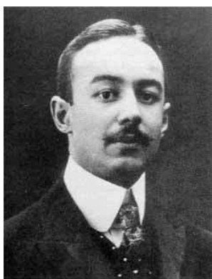
Слика 4 Николај Николајевич Врангел (1900)