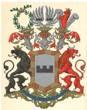
Слика 1 Грб породице Врангел

Петар Николајевич Врангел био је далеки потомак данске гране Толсбург-Елистфер династије Врангел, чији корени датирају још из XIII века. 16 Родоначелник династије Врангела био је један од вазала данског краља Валдемара II (1202-1241), који је био у војној служби Краљевине Данске приликом заузећа Естоније 1219. године у дворцу Ревеле (касније град Ревел, сада Талин, Естонија), када је основан дански гарнизон на челу са одређеним бројем „мужева краља“ (yigi regis), а међу њима је наведен извесни Доминус Туки Вранг (Dominus Tuki Wrang). Потомци Вранга су најпре названи, de Wranghele, затим Wrangele, да би се на крају усталио назив Врангели. У XVI веку род Врангела се поделио на 20 независних линија. Почетком 20. века, према броју њихових представника, руске гране рода Врангела заузимају прво место са 40 потомака, шведске друго са 37, а последње пруске (немачке) са 11 чланова рода Врангел. 17