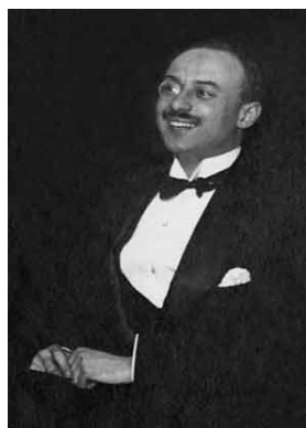
Слика 5 Николај Николајевич Врангел (1912)

Николај Николајевич био је две године млађи брат генерала Петра Николајевича. Рођен је у селу Головка у Кијевској губернији 14. јула 1880. године. Врангели су 1884. године добили још једног сина Всеволода (1884-1895), 27 али је најмлађи син преминуо од дечје дифтерије са само десет година.