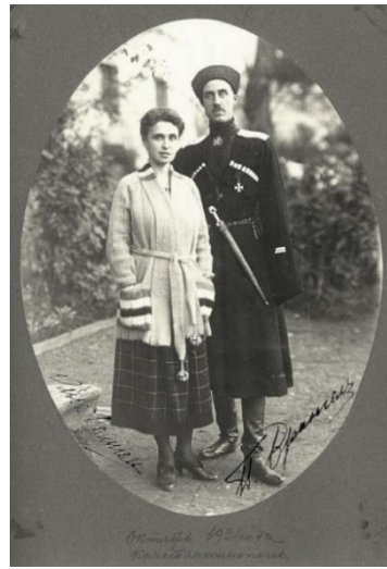
Слика 7 Олга и Петар Врангел (1921)

На самом почетку Грађанског рата на Криму, у Јалти, причало се о томе како је супруга Олга спасила барона Петра Николајевича Врангела од сигурне смрти. Он је то и лично признавао. Наиме, након Октобарског преврата и општег расула у којем се Русија нашла, Врангел је отпутовао на Јалту, Крим, код тазбине који су имали своју вилу. Међутим, ни Крим није био миран, јер је постао поприште „црвеног терора“, где су хапшени сви угледнији грађани и најчешће без суђења ликвидирани. Генерала Врангела су ухапсили 11. јануара 1918. године. Он пише о томе: „Смештали су нас у аутомобил, кад, гурајући се кроз масу, моја жена похрли према возилу и ухвати се за врата, покушавајући да и она седне. Морнари је нису пуштали, а и ја сам је наговарао да остане. Није одустајала (...) `Схватила сам. Све је свршено. Остајем уз тебе!` Пред њеним очима руља је стрељала једног официра (...) Под конвојем црвеноармејаца повели су нас у зграду царинарнице (...)“. 31 У разговору са комесаром показала је изузетну храброст и истрајност. На питање: „А зашто су вас ухапсили?“, она одговара: „Нису ме ухапсили, добровољно сам дошла овамо са мужем. На коментар: „Види, види... а чему?“, одговорила је: „Срећно сам живела с њим, па желим до краја да делим