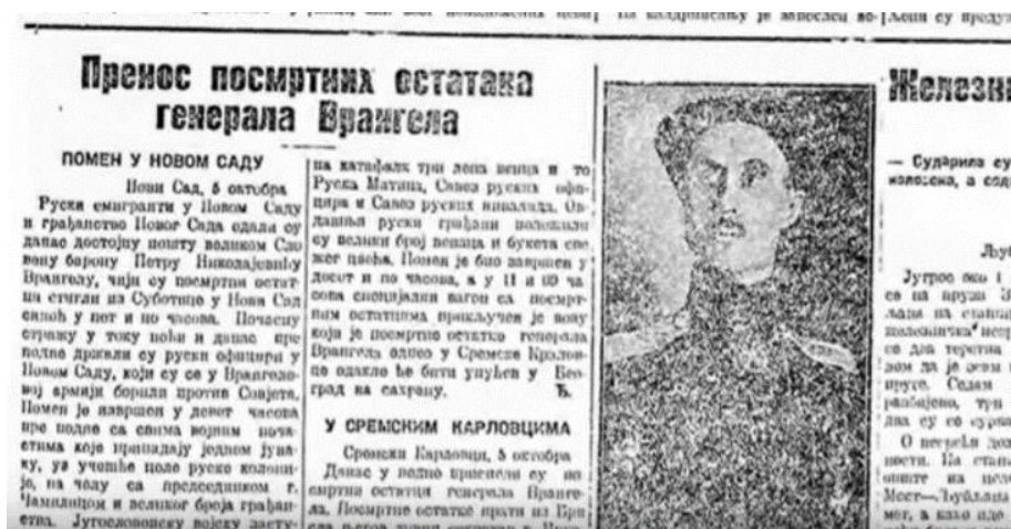
Слика 11 Политика , 6. октобра 1929.

У периоду од 1922. до смрти генерала Врангела 1928. године, Политика скоро да није давала никакве информације о делатности последњег руског антибољшевичког врховног команданта. Његова смрт и пренос посмртних остатака из Брисела у Београд нису сматрани ударним вестима.