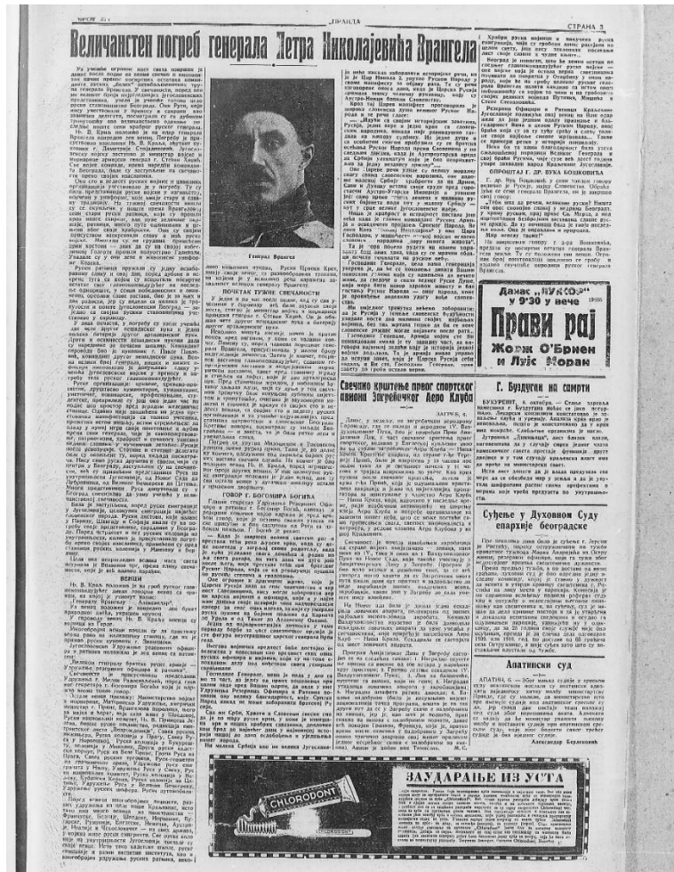
Слика 16 Правда , 7. октобра 1929.