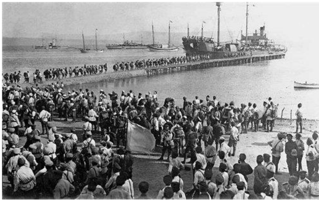
Слика 5 Отъезд первого эшелона кавалерии в Сербию 1921. (Одлазак првог коњичког ешалона у Србију. Већина избеглица из Русије нису ни znale да је створена Краљевина СХС, говорили су да одлазе у Србију.)