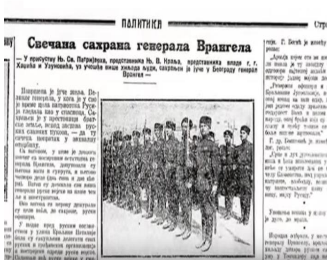
Слика 12 Политика , 7. октобра 1929.