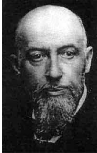
Слика 2 Николај Јегорович Врангел, отац генерала Врангела (1890)

Отац Петра Николајевича Врангела био је најмлађи син богатог руског земљопоседника Јегора Јермолаевича Врангела и баронице Дарије (Доротеје) Александровне Рауш фон Траубенберг, која је директан потомак Етиопљанина Ибрахима (Аврама) Ханибала за време руског цара Петра Великог. Мајка Николаја Јегоровича преминула је још док је био дечак. Африканац на двору првог руског императора био је њен деда. Наиме, надареног дечака Ибрахима из Етиопије, руском императору је поклонио османски султан 1705. године. 19